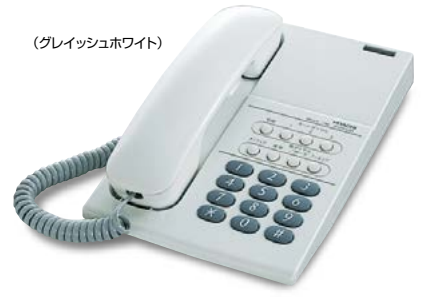
(グレイッシュホワイト)