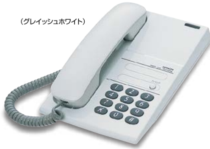
(グレイッシュホワイト)