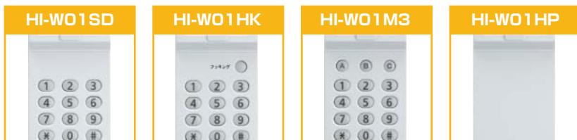
スタンダードタイプ